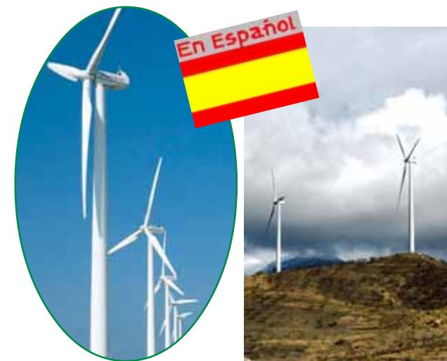
Molino en España.

Red internacional por la energía sostenible